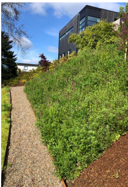
Installert blomstereng i en skråning.

Blomsterengmattene er laget av en regional frøblanding fra Sørøstlandet og inneholder 17 stedeagne arter. Mattene bør legges på tørr og mager jord (for eksempel sandbasert torvjord) i solfylte områder som vender mot sør eller vest. Mattene kan legges både på tak og på bakken. Det anbefales ikke å etablere blomstereng på næringsrike, oppgjødslate arealer. Mattene legges på et minimum 5 cm tykk lag med næringsfattig jord, og de skal vannes de første 3–4 ukene slik at vegetasjonen etablerer seg godt på det nye voksestedet.