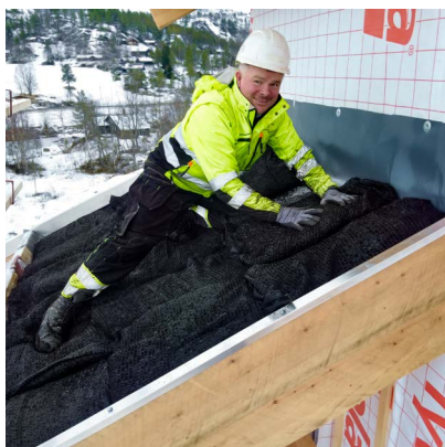
Utlegging av småsekker.

Forbruk på tak: Det brukes 4 små sekker pr m 2 Én stor sekk dekker 10 m 2