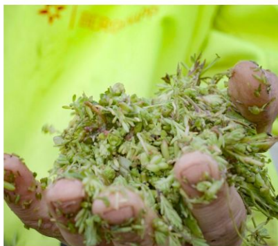
Legging av sedumstikling.

Sedum er betegnelsen på forskjellige bergknapparter i bergknappfamilien. Dette er lavvokste, sukkulente planter som stiller lite krav til sitt voksested. I naturen vokser de på svaberg og berg- knauser. De er tørketålede og egner seg derfor godt på taket. Artene er 5–10 cm høye og har gule, rosa eller hvite blomster. Sedum krever lite vedlikehold, men likevel er gjødsling og fjerning av ugress avgjørende for at taket skal holde seg grønt og frodig år etter år.