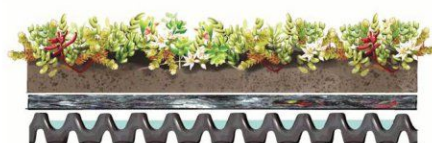
Ferdig utlagt sedumsystem. Dreneringsmatter fungerer som vannreservoar.